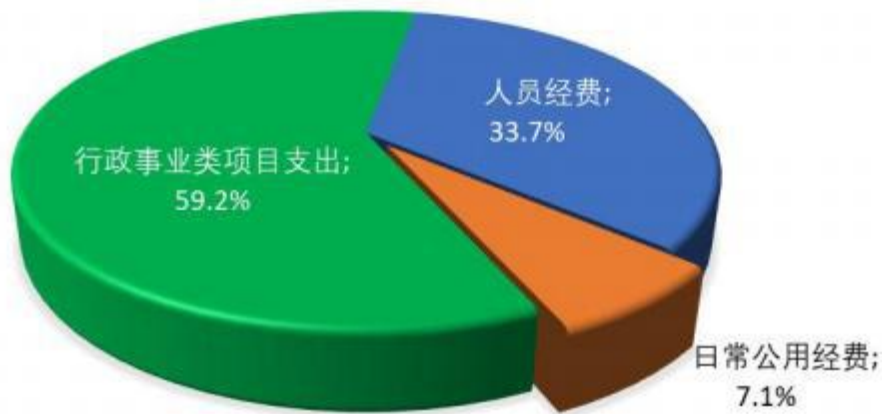
图 2：支出构成情况（按支出性质）